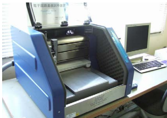
図 1 装置外観

本システムは CAM データに基づいて基板表面の銅箔を削って回路パターン形成、穴あけ加工を行う電子回路基板作成装置です。装置外観を図 1 に示します。両面 2 層基板の加工が可能です。基板は、加工しやすく銅箔の剥がれにくいガラスエポキシ基板を一般的に用います。汎用電子回路 CAD で作成された CAM データを、図 2 に示す本システム専用のソフトウェアで編集して加工データに変換します。CAD データそのものを回路パターン化出来るため、集積された電子回路基板を短時間で試作することが可能です。