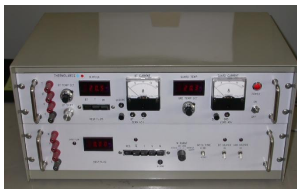
図2 制御・計測装置

わたや羽毛の製品、あるいは重ね着をすることは「静止状態の空気層」を着用することになるので、高い保温性が得られます。