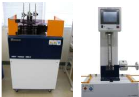
図2 荷重たわみ試験機(左)とアイゾット衝撃試験機(右)

アイゾット衝撃試験は、ノッチ(V溝)を付けた試験片に、衝撃を加えて破断させることで、プラスチックの衝撃強さを求めます。衝撃強さはアニール処理や熱劣化により変化(低下)することから、熱の影響を評価することができます。