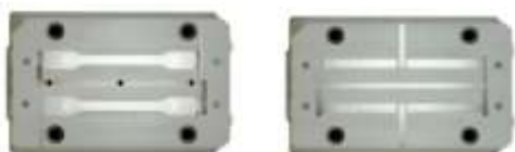
図1 試験片作製用金型 (左：タイプ A、右：タイプ B)

JIS K7139:2009 に規定するタイプ A(多目的試験片)、タイプ B(短冊形試験片)金型で、JIS K7162:1994「引張試験」に対応した多目的試験片(JIS K7113:1995 は H22 に廃止)の成形が可能です。他にも、JIS K7110:1999「アイゾット衝撃試験」、JIS K7111:2006「シャルピー衝撃試験」、JIS K7171:2008「曲げ試験」、K7191:2007「荷重たわみ温度試験」に準拠した各種試験片を作製できます。