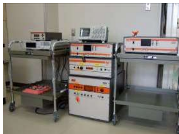
図3 耐放射電磁界試験装置