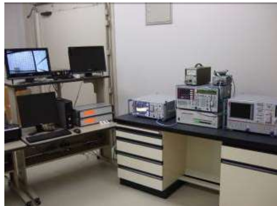
図2 EMI テストシステム

電波暗室内に設置したアンテナから電波を放射し、被試験機器が正常に動作できるかを試験します。マイクロ波帯の発振器、電力増幅器等の導入により、1GHz 以上の放射電磁界イミュニティ試