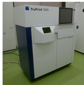
金属積層造形装置

当センターでは、令和3年度から利用を開始した金属積層造形装置や粉末製造装置の活用方法や、それを活用した事例について、技術セミナーでご紹介するとともに、技術導入に興味のある企業を対象に、相談会（個別相談）を開催します。また、当センター材料分野の技術・設備についても合わせてご紹介します。