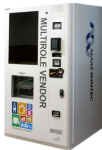
次世代型冷蔵物販自販機 (株)マースウインテック