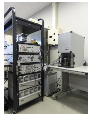
試験番号 19 過渡熱測定 (サーマルデバイス評価装置)