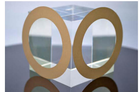
カッティングブレード

各工程で残留した内部応力が、最終工程により十分除去されることが確認され、工程改善、製品の高信頼性化につながった。 今後はひずみ取り工程の最適化を検討する予定。